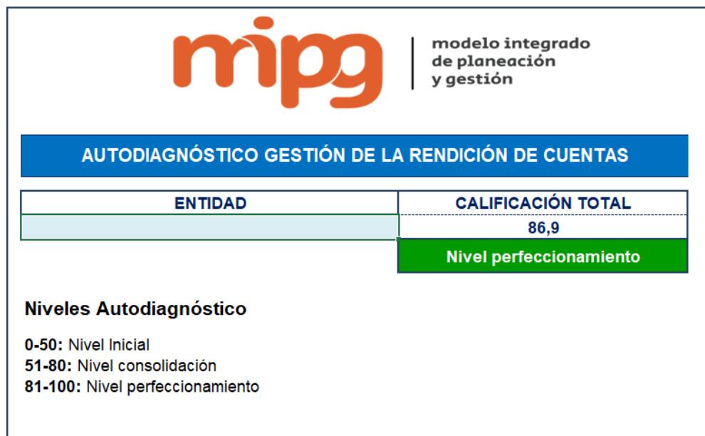
Ilustración 1 Clasificación Autodiagnóstico.

En relación con los resultados del Autodiagnóstico, es importante señalar que el Manual Único de Rendición de Cuentas indica que en el nivel inicial se encuentran entidades que adelantan las primeras experiencias en la rendición de cuentas; en el nivel de consolidación se ubican aquellas que cuentan con experiencia y requiere fortalecer diferentes aspectos del proceso y en nivel de perfeccionamiento se encuentran las entidades que “han calificado su proceso y requieren perfeccionar sus estrategias de rendición de cuentas”.