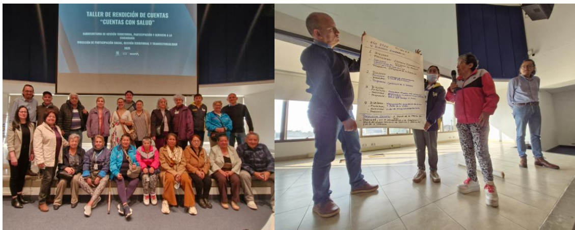
Ilustración 3 Taller de construcción conjunta de Rendición de Cuentas 2025. Equipo Control Social

Por otra parte, se realizó el día 20 de enero de 2025 el taller de construcción conjunta para la Estrategia de Rendición de Cuentas “Cuentas con Salud”, con el propósito de recibir las consideraciones y observaciones de integrantes de las veedurías ciudadanas y de instancias de participación en salud. El taller de construcción conjunta se desarrolló bajo una metodología participativa, donde 10 personas organizadas en subgrupos y haciendo un análisis, respondieron preguntas orientadoras, que permitieron identificar el conocimiento del concepto de rendición de cuentas, temas tratados y abordados en los diálogos ciudadanos y la audiencia pública del año anterior, así como su evaluación y propuestas al respecto.